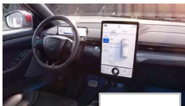
Ford SYNC 4A