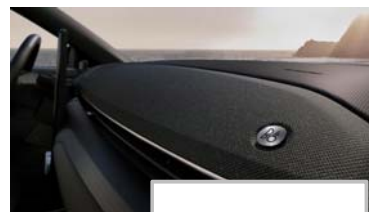
B&O zvočni sistem